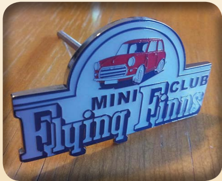
MASKIMERKKI 7CM X 4CM 20€ EMALOITUA MESSINKIÄ.