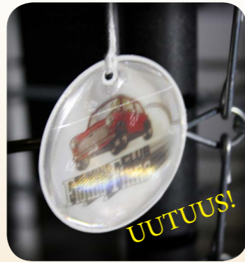
HEIJASTIN 5€ (NARU JA HAKANEULA SIS.)