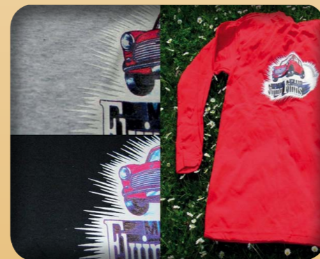
PITKÄHIHAINEN PAITA 10€ - HARMAA, MUSTA, PUNAINEN - PAINATUS SELKÄPUOLELLA