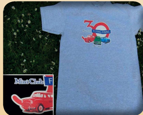
T-PAITA 30V 15€ - MUSTA JA HARMAA