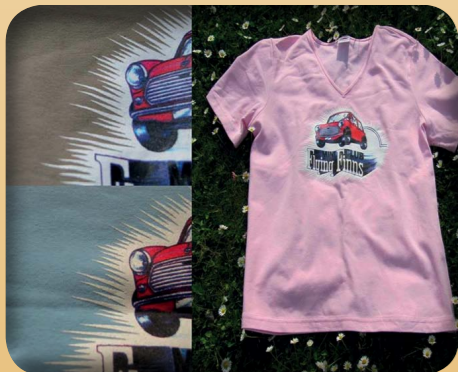
T-PAITA LADY-FIT 13€ - RUSKEA 10€!