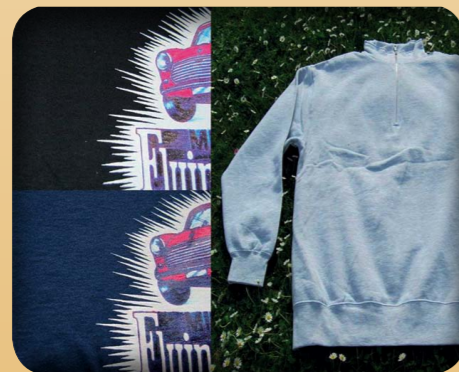
SVETARI 20€ - PAINATUS SELKÄPUOLELLA