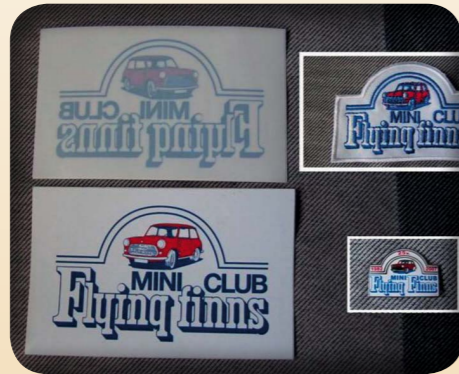
TARRA 1€, KANGASMERKKI 4€, PINS- SI 4€