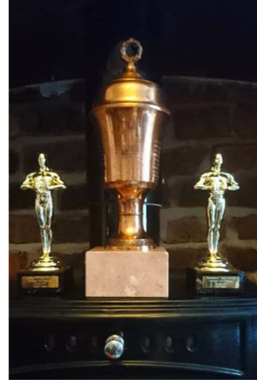
Vuoden Ministi palkinto matkasi Salli Pagen mukana Englantiin.