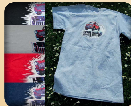
T-PAITA 13€ - MUSTA, VALKOINEN, PUNAINEN, SININEN JA HARMAA