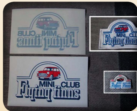
TARRA 1€, KANGASMERKKI 4€, PINS- SI 4€