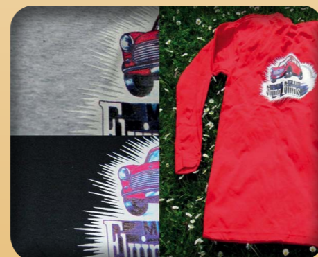
PITKÄHIHAINEN PAITA 10€ - HARMAA, MUSTA, PUNAINEN - PAINATUS SELKÄPUOLELLA