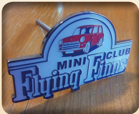
MASKIMERKKI 7CM X 4CM 20€ EMALOITUA MESSINKIÄ.