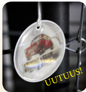
HEIJASTIN 5€ (NARU JA HAKANEULA SIS.)