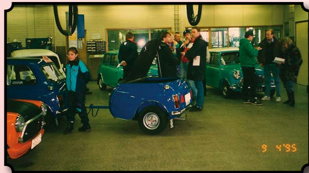
Kun BMW:ltä tuli uusi mini vuonna 2001 pirkanmaan teamilaiset pääsivät koeajolle.

Mitä muuta olemme touhunnut: Pirkanmaan team on järjestänyt viralliset Mini Club Flying Finns kesä kokoontumiset, Pälkäneellä(3 kertaa), Härmälän leirintä alueelle ja Somerolla. Vuorossa olisi taas lähivuosina. Saunailtoja olemme järjestelleet syksyisin jo vuodesta 2002. Saunailloissahan on tietysti saunottu, nautittu hyvästä ruuasta (nyyttäreinä/kannustin rahan turvin) sekä erilaisia kilpailuja/tehtäviä ja seurustelua. Saunailtoja olemme viettäneet Pihlajaniemessä, Iso-Heritty, FHAK-tiloissa useita kertoja, Jantusella ja Hiltusella, Nurmella sekä Kaivo-ojalla. Olemme myös puuhaillet muutakin. Vuonna 1995 vietettiin Lakalaivassa mininäyttely jossa oli monenlaista miniä katseltavana.