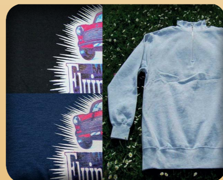
SVETARI 20€ - PAINATUS SELKÄPUOLELLA