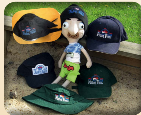
PANDANA 8€, PIPO 15€, LIPPIS 12€, LIPPIS RETRO 15€, KALASTAJAHATTU 12€