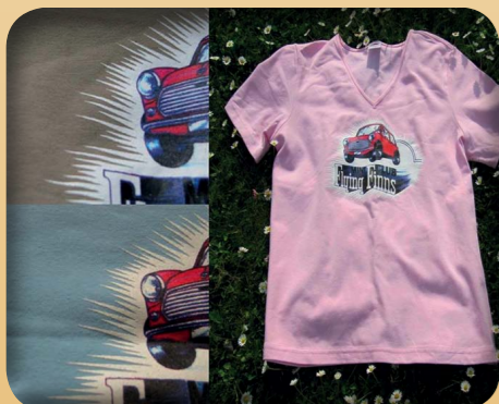
T-PAITA LADY-FIT 13€ - RUSKEA 10€!