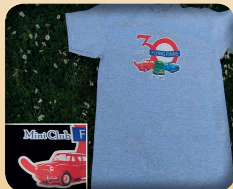
T-PAITA 30V 15€ - MUSTA JA HARMAA