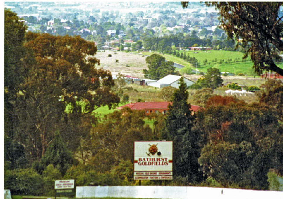
Kuva Bathurstin radan jyrkästä alamäkiosasta.

Menemme sisään ja huomaan, että on kysymyksessä pienen korjaamon töiden vastaanottotila. Näkyy hyllyillä sentään varaosia, joten arvelen niitä myöskin myytävänä. Meitä tulee palvelemaan mukavanoloinen keski-ikäinen mies. Arto kertoo "tarpeemme", jonka jälkeen alkaa pitkä selitys ja sanan vaihto