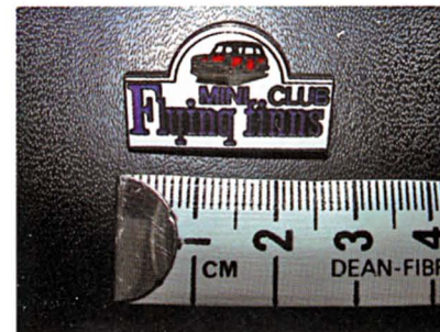
Pinssi, hinta 4 €