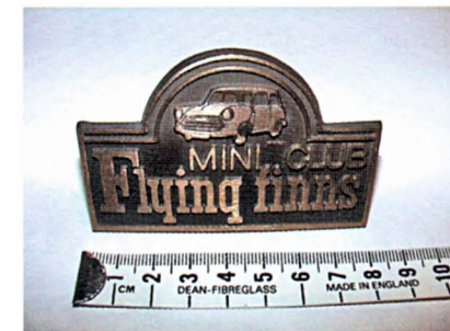
Keulamerkki, hinta 47 €