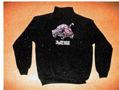
Svetari, hinta 30 €