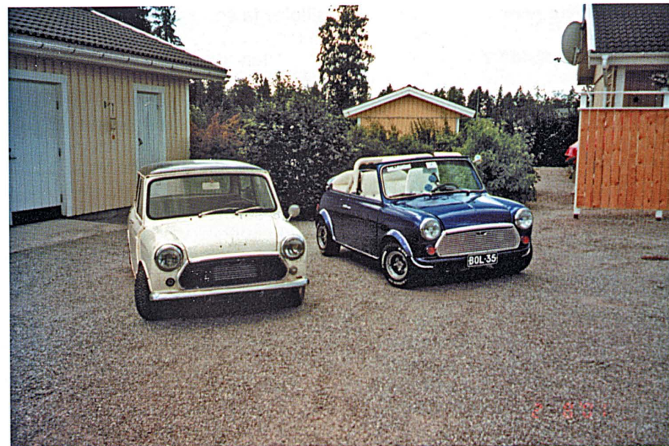
Viereisellä sivulla pitkän projektin alku ja tällä sivulla lopputulos.

Vuonna -99 sain rakennusluvan ja sen jälkeen innostuin rakentamaan jotain erikoista. Alkuperäinen takaluukku on kiinni hitsattu ja hattuhyllyn tilalla on laitettu takaluukku siipineen. On käytetty vain peltiä. Pohjassa on hitsattu vahvistusrunko. Etuisuimet on Datsun 100A:sta ja takapenkki on alkuperäinen, niitä suutari päällysti valkoisella kei-nonahalla.