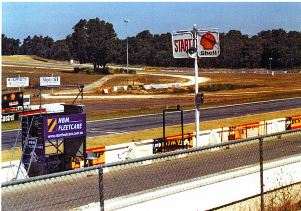
Barbagallon rata-alue, jossa ajetaan mm. Historia luokka.

Totesimme, ettei matka ole kovin pitkä, mikä olisi voinut olla mahdollista, kun kyseessä on matlaan rakennettu miljoonakaupunki. Kun saavumme 47 Irvine Streetin kohdalle sanoin, että kylä on oikea paikka. Pihalle nousee loivaa rinnettä, jota reunustaa nättiin pinoon kerätyt takakelkat ja etukelkat. Oman röykkiön muodostavat konepellit, ovet sekä takaluukut. Liikkeen nimi Minicraft varmaan näkyy jossakin, mutta minulta se on jo unohtunut.