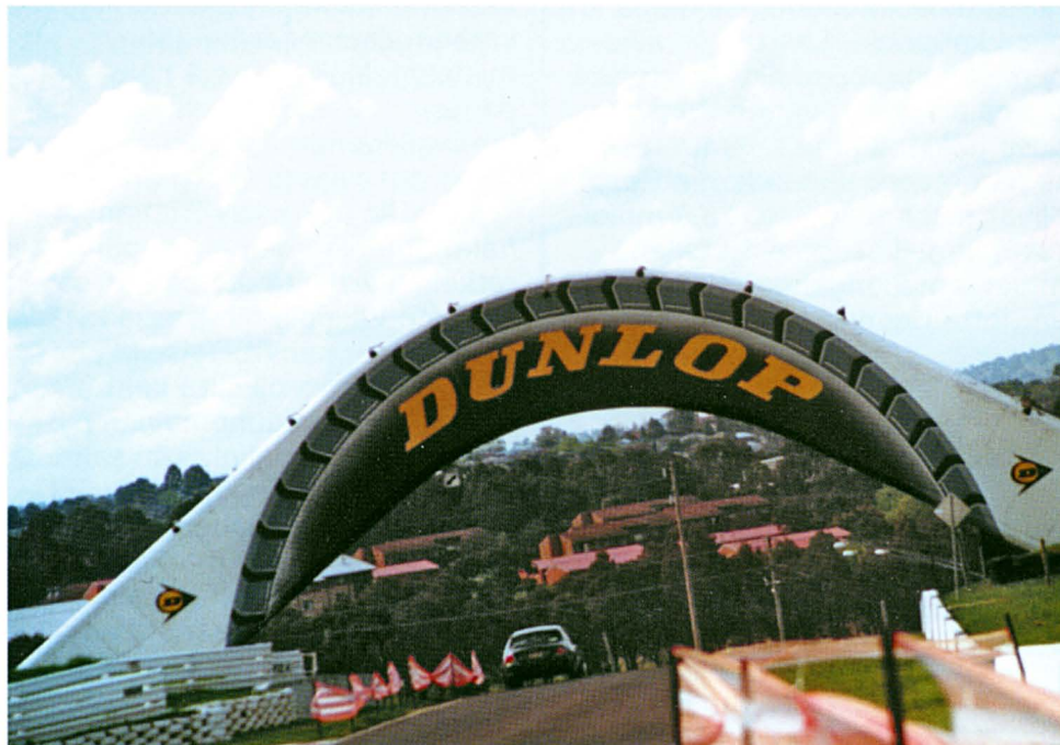
Bathurst. Dunlop portti oli radan alimmalla osuudella.