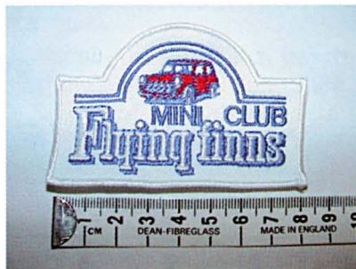
Kangasmerkki, hinta 4 €