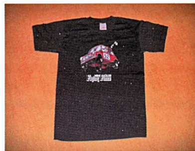
T-paita, hinta 13 €

Mini Clubin kerhotuotteita myydään lähes kaikissa kerhon tapaamisissa (ei paikallistapaamisissa), sekä postitse. Postitse tilaaminen tapahtuu niin, että tilaaja tilaa haluamansa tavarat Mira Jokiselta ja maksaa laskun loppusumman kerhon tilille. Kun maksusta on mennyt tieto Miralle, hän postittaa paketin tilaajalle.